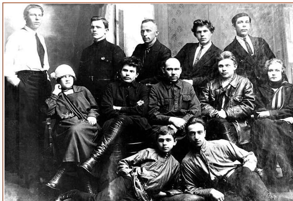
Бюро комсомольской ячейки завода (02-08.1926 г.)