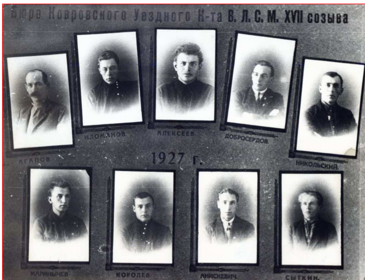
Члены бюро Уездного комитета комсомола (1927 г.)