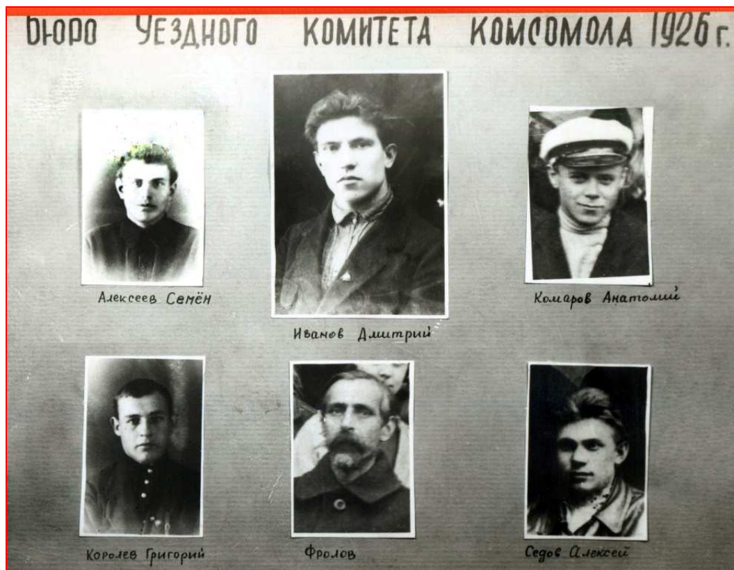
Бюро Ковровского Уездного комитета РКСМ (1926 г.)