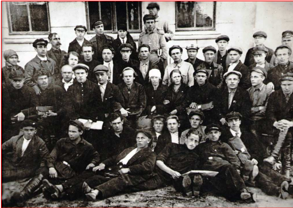
Пленум Уездного комитета РЛКСМ (1926 г.) (фото от Г.В.Жуковой)

Канд. в члены Бюро Укома РЛКСМ: Седов (секр. яч.№1 – пульзавод), Андреинов (секр. яч.№15 – ФиА), Иломанов (секр. яч.№3 – ф-ка Свердлова)...» [ГАВО, 1926].