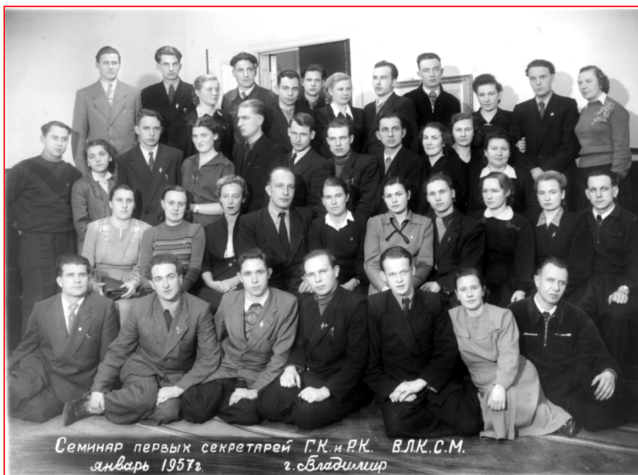
Семинар первых секретарей ГК и РК ВЛКСМ. январь 1957г. г. Владимир