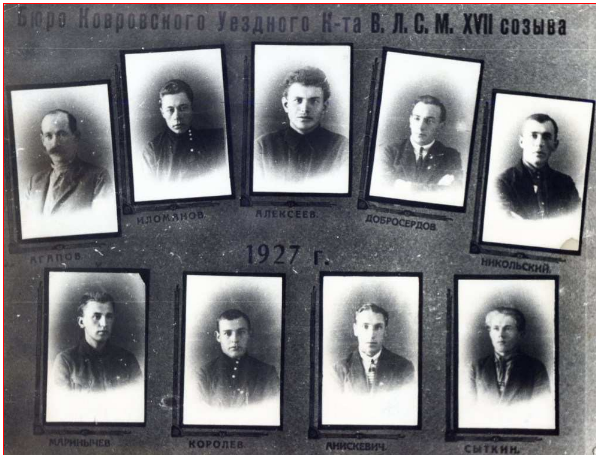
Члены бюро Уездного комитета комсомола (1927 г.)