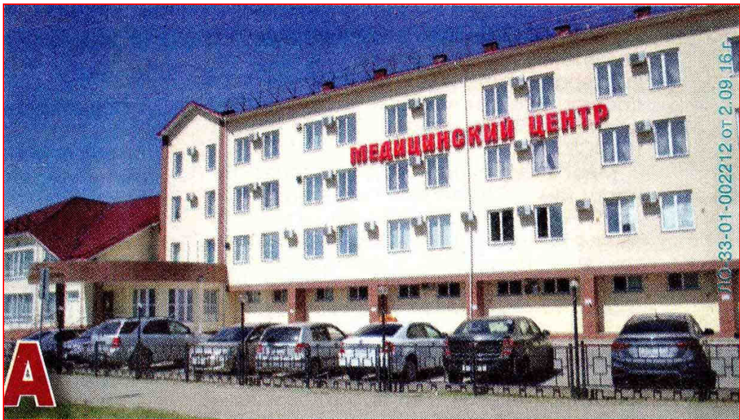
Медицинский центр ОАО «КЭМЗ» ( «ЗТ» , 18.06.2019)