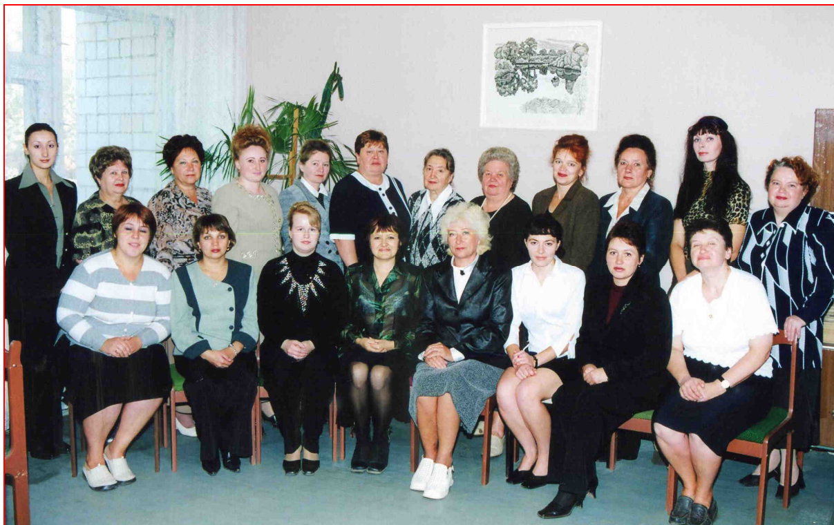
Коллектив детской поликлиники № 3 (2004 г.)