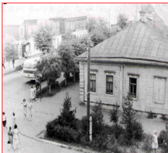
Дом медицинского работника (1949 г.)

(угол улиц Н.С. Абельмана и М.С. Урицкого, виден вход в парк КЭЗ и 4-й дом)