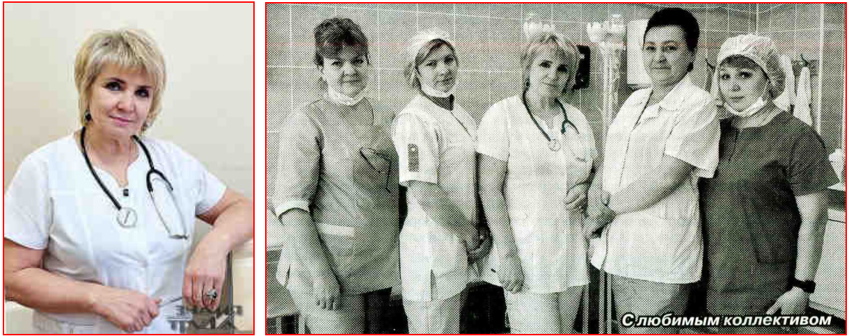
Гинекологическое отделение ЦГБ [«ЗТ», 27.12.2022]