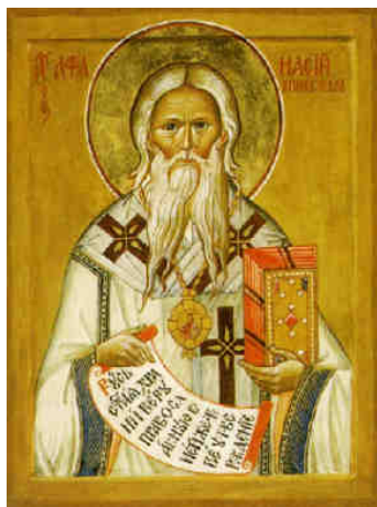
Свт. Афанасий. Волочкова И.В. (храм свт. Николая на Маросейке). Икона. Москва. 2000 г. Храм свт. Николая на Маросейке (в Клёниках)

Полностью восстановлена ныне гражданская справедливость в отношении владыки Афанасия: к 1998 г. он был реабилитирован (посмертно) по всем делам, по которым был судим, начиная с 1922 г. ...» [«Житие святителя Афанасия», М., 2000].