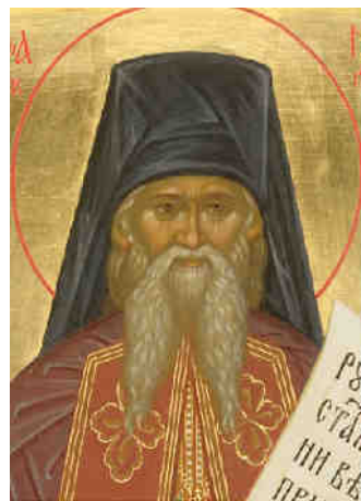
Свт. Афанасий. Глазовская В.С. (Иконописная школа). Сергеев Посад. 2002 г. Троице-Сергиева Лавра.

Более подробно можно ознакомиться в брошюре «Житие святителя Афанасия, епископа Ковровского, исповедника и песнописца». М.: «Отчий дом», 2000. С. 3-21.