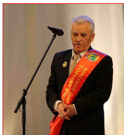
«Книга почётных граждан города Коврова», – http://www.kovrov-museum.ru/museum/person/honorary-book/2020