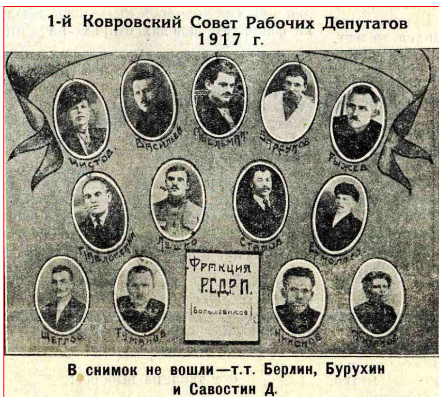
Фракция большевиков в 1-м Ковровском Совете рабочих депутатов (март 1917 г.) [ «Десятилетие Октябрьской революции» , 1927]