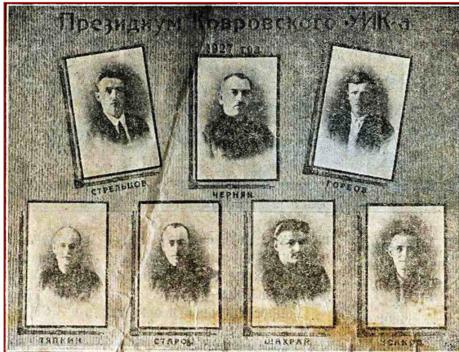
Президиум Ковровского Уездного исполкома (1927 г.) («Десятилетие Октябрьской революции», 1927)