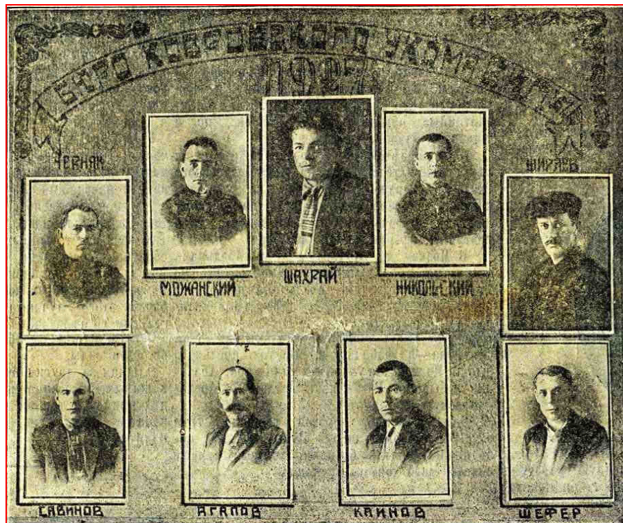
Бюро Ковровского Укома ВКП(б) (1927 г.) («Десятилетие Октябрьской революции», 1927)