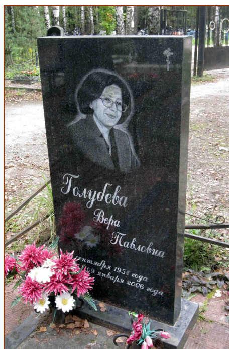
Похоронена на Троицко-Никольском кладбище