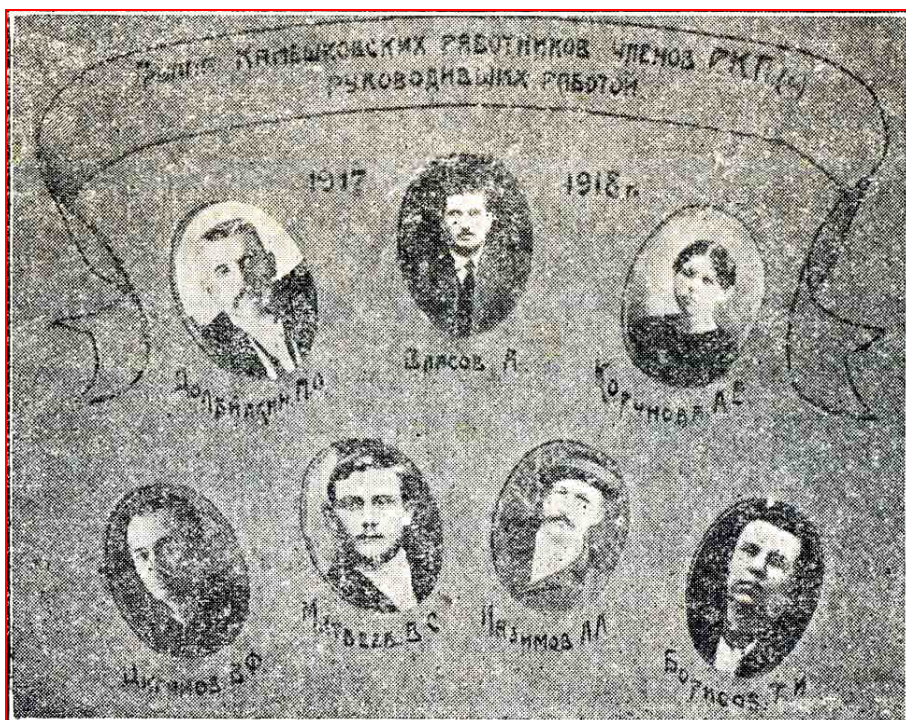
Ячейка РКП(б) фабрики им. Я.М. Свердлова (1917-1918) [«Десятилетие Октябрьской революции», 1927]