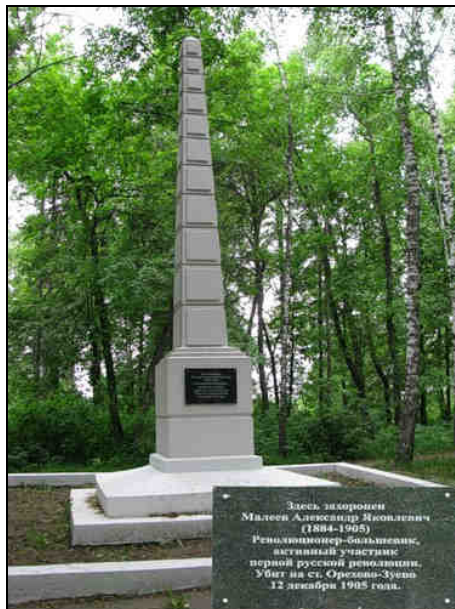
Новый памятник на могиле А.Я. Малееву на Иоанно-Воинском кладбище (с 1949 г.)

«Ковровские власти выступили с инициативой реконструкции памятника одному из первых революционеров города!»