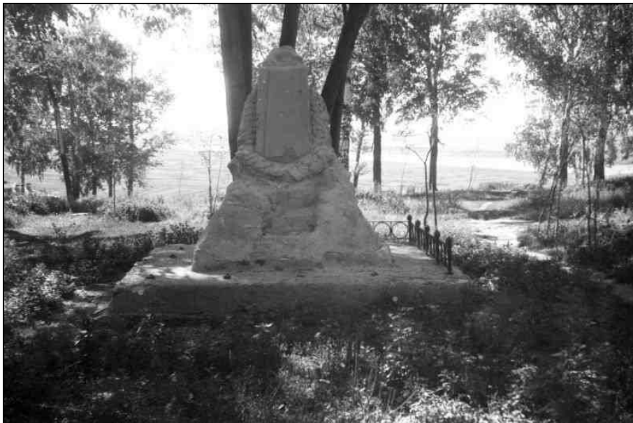
Могила А.Я. Малееву на Иоанно-Воинском кладбище (до 1940 г.)