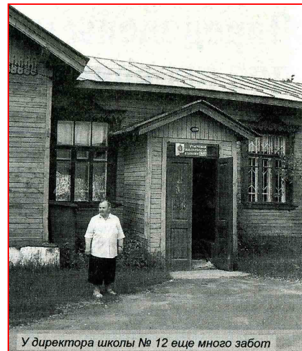
У директора школы № 12 еще много забот