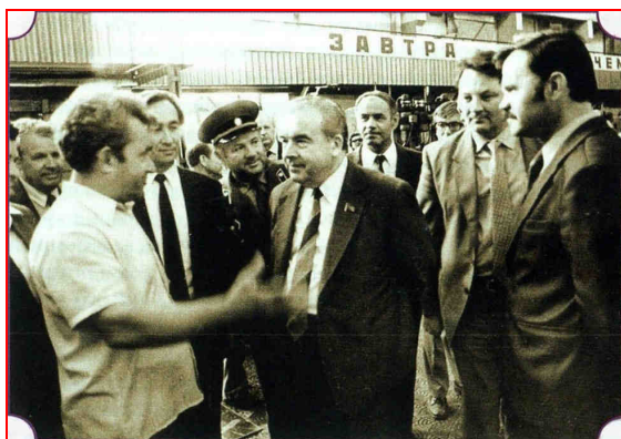
Министр оборонной промышленности СССР П.В. Финюгин в цехе № 25 завода им. В.А. Дегтярева

В начале нового века появились заказы на новые изделия: «Корнет», «Игла-С», появилась почвообрабатывающая техника, расширяющая возможности мотопроизводства. Завод жил и развивался...» [ ЗТ », 26.06.2002].