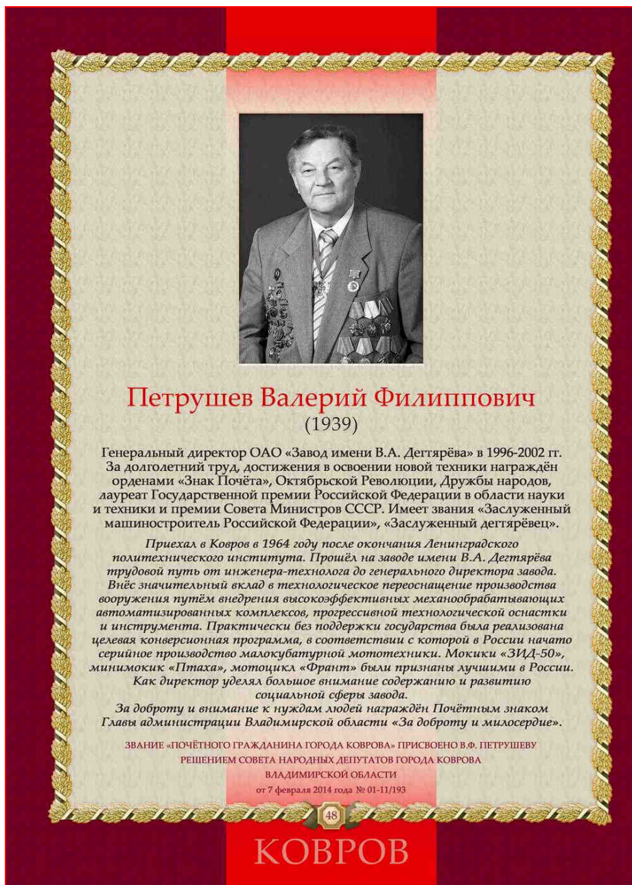
«Книга почётных граждан города Коврова», – http://www.kovrov-museum.ru/museum/person/honorary-book/2016 .