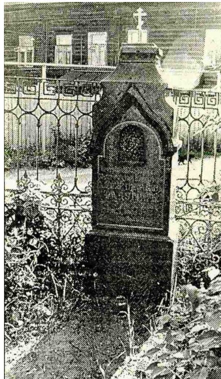
надгробие А.Г. Радугина

«7 июля 1905 г. скончался протоиерей Ковровского Христорождественского собора Алексей Григорьевич Радугин .