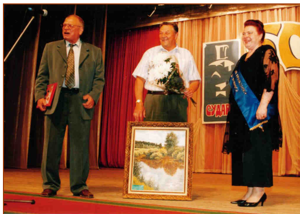
Почётный гражданин г. Коврова