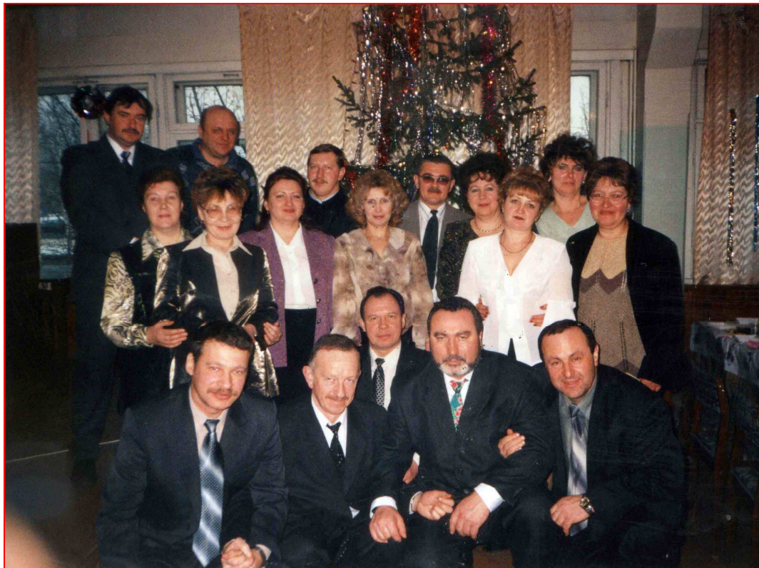
Руководящий состав УТТ (2003-2005 гг.)