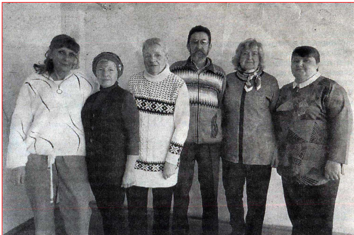
На этом снимке – «ветеранская гвардия» ковровского УТТ

Сейчас две дочери пошли по моим стопам...» [ «КН», 28.10.2021 ].