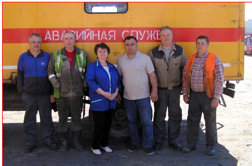
1-я смена службы энергохозяйства (22.05.2024)