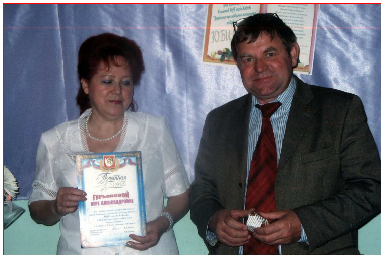
Вручение знака «Почётный работник транспорта России» (2003)