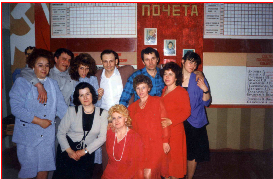
В «Красном уголке» (2003-2013 гг.)