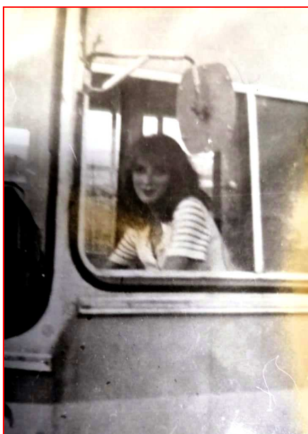
Веденева О.М. – водитель троллейбуса