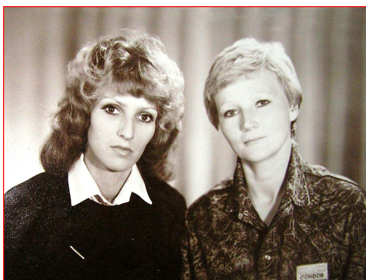
Веденева О.М. и Жукова Н.А.